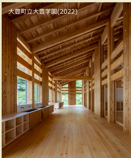
大豊町立大豊学園(2022)

木造・CLTにかかわる各分野の名手に聞く！ 強く・美しく・合理的に木質材料を活用するためのアイデアとは？