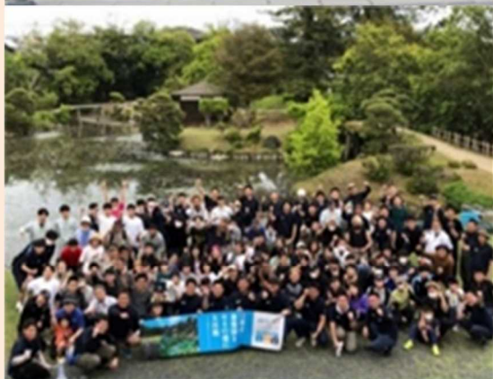
令和4年度 津山市景観賞 【景観活動部門】 目指せ！衆樂園をモネの池に大作戦