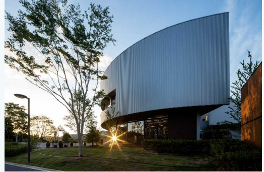
平成 30 年度 津山市景観賞 (奨励賞) 「メディカルアルファ～大手町薬局～」