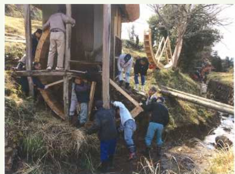
平成 29 年度 津山市景観賞 「勝部桐の木水車を守る会」