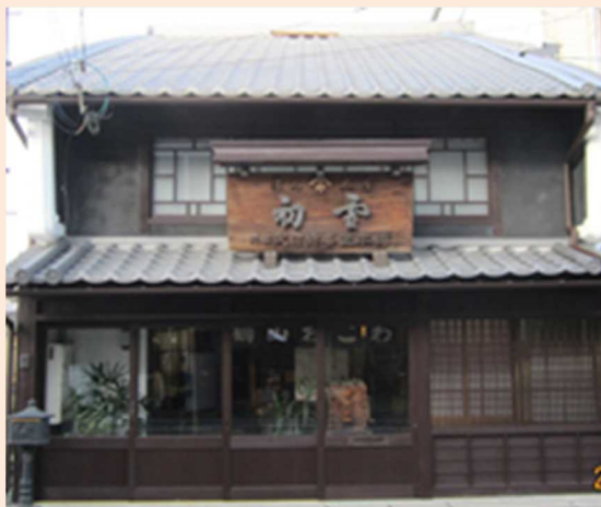
令和4年度 津山市景観賞 【建築物部門】 武田待喜堂修理