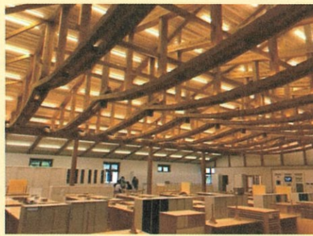
「あわくら会館」内観(執務室)