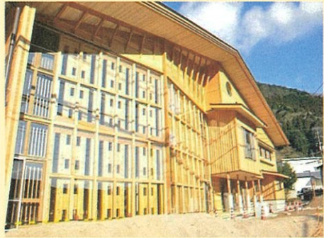
「あわくら会館」外観

木材利用推進中央協議会「令和3年度 木材利用優良施設コンクール」において“ 内閣総理大臣賞 ”を受賞した『 あわくら会館 』を見学します。本施設は、木材の調達・流通や建築・家具デザインなど、地域の川上から川下までの事業者が協働することにより建てられた木造庁舎・図書館で、木材供給スケジュールに合わせた工程の設定等の工夫により、使用した木材の村産材率97%を実現しました。多くの皆様のご参加をお待ちしています。