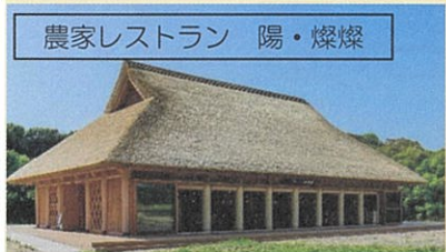
農家レストラン 陽・燦燦

ジェームス氏没後、老朽化した歴史的建築物の再利用計画が検討されたが、第一種低層住居専用地域であるため、法的規制の中での保存と利活用を両立させるスキームが必要であった。それをどのように解決していったのか。文化遺産を「使って遺す」。