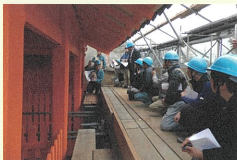
△保存修理現場での勉強会の様子

岡山ヘリテージマネージャー機構(OHMO)は、一般社団法人岡山県建築士会の部会の一つで、平成27年度に創設されました 本会に「岡山ヘリテージマネージャー」または「岡山ヘリテージサポーター」として登録した会員により構成し、活動は岡山県内の歴史文化遺産を発見し、活用し、地域づくりに活かすことを目的とし、そのためのスキルアップを図る勉強会等を実施しています