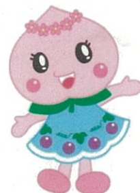
赤磐市マスコットキャラクター あかいわももちゃん

〔※当事業の、事業者説明会を令和3年12月22日に実施します。事業の概要説明、質疑応答等を予定していますので、募集要項をご確認のうえ、お申込みください。〕