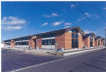
土浦北インター自動車学校

2050年「カーボンニュートラル」を見据え、脱炭素社会実現のため、公共建築物利用促進法の対象が民間建築物にも広がります