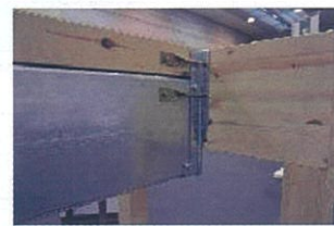
エス・ウッド・ビーム・モア