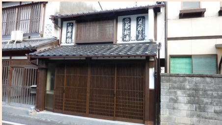
令和元年度 津山市景観賞 「水のや 漆喰壁看板復元」