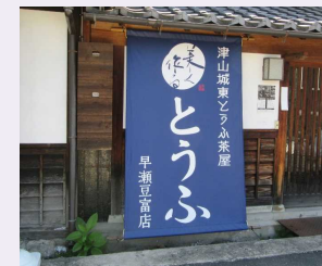
平成29年度 津山市景観賞(奨励賞) 「津山城東とうふ茶屋 早瀬豆腐店」