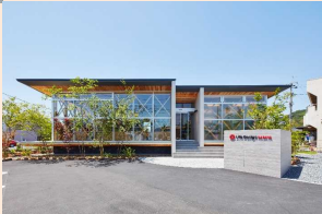
令和元年度 津山市景観賞(奨励賞) 「ライフデザイン・カバヤ株式会社 津山営業所」