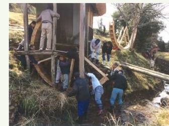
平成29年度 津山市景観賞 「勝部桐の木水車を守る会」