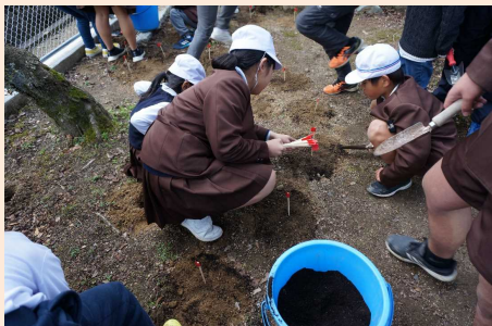
令和2年度 津山市景観賞 「秀実小学校 学び舎の桜を救おうプロジェクト」