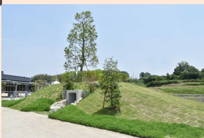
令和2年度 津山市景観賞(奨励賞) 「やよい保育園 こどもの森」