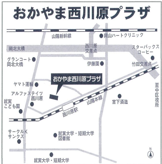
所在地：岡山市中区西川原255