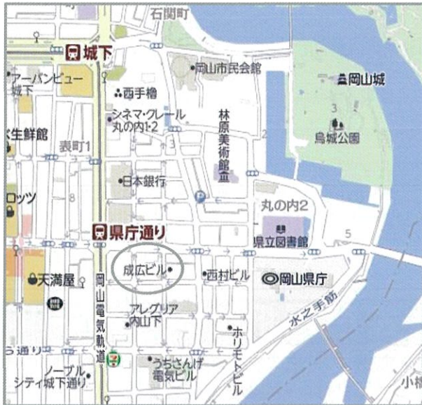
所在地：岡山市北区内山下1-3-19 建築会館(成広ビル)

一般社団法人岡山県建築士会 〒700-0824 岡山市北区内山下 1-3-19 建築会館 4階 電話：086-223-6671 F A X：086-221-2185 一般社団法人岡山県建築士事務所協会 〒700-0824 岡山市北区内山下 1-3-19 建築会館 3階 電話：086-231-3479 F A X：086-231-4575 ※建築会館(成広ビル)には専用駐車場がございません。近隣のパーキングをご利用ください。