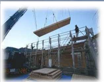
CLT Cross Laminated Timber 板の層を各層で互いに直交 するよう積層接着したパネルと 鉄骨造の作業所