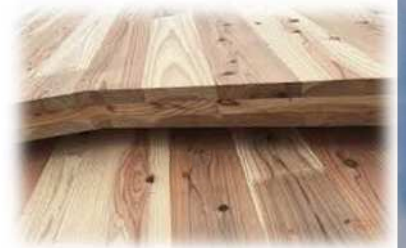
CLT利用 屋根下地 90mm厚