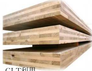
CLT利用 2階床 150mm厚