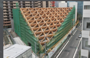
大東建託 ROOFLAG賃貸住宅未来展示場