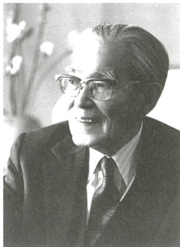
建築家 浦辺鎮太郎

倉敷のデュドクになってやろうと考えたんだ。ヒルバーサムという当時人口5万くらいの町の市役所に勤めてね、そして建築家となってその町の大事なものはほとんど一人でみんなやっちゃった。(中略)ぼくの卒業設計を見てもデュドクばかりですよ。