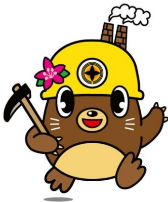
田川市マスコット キャラクター「たかたん」