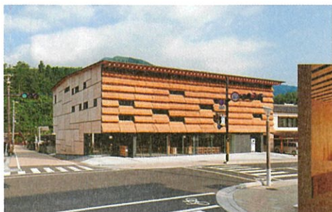
まちのえき(物産展)+マルシェユスハラ(ホテル) 設計:隈 研吾