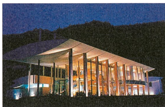
雲の上ホテル 設計:隈 研吾