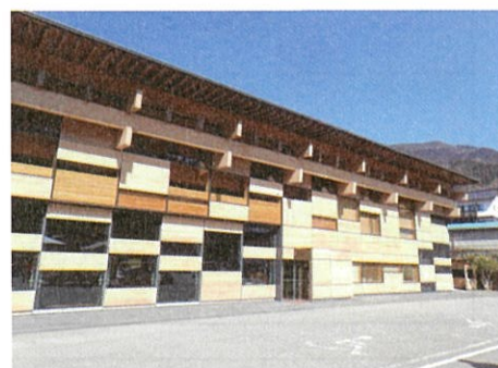
梶原町役場 設計:隈 研吾