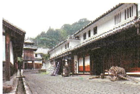
吉田ふれあい国安の郷

参加ご希望の方は、裏面の申込書に必要事項をご記入、参加費受領書の写しを貼付の上、10月13日(金)までに建築士会事務局までFAX(086-221-2185)してください。折り返し、受付資料等お送りします。