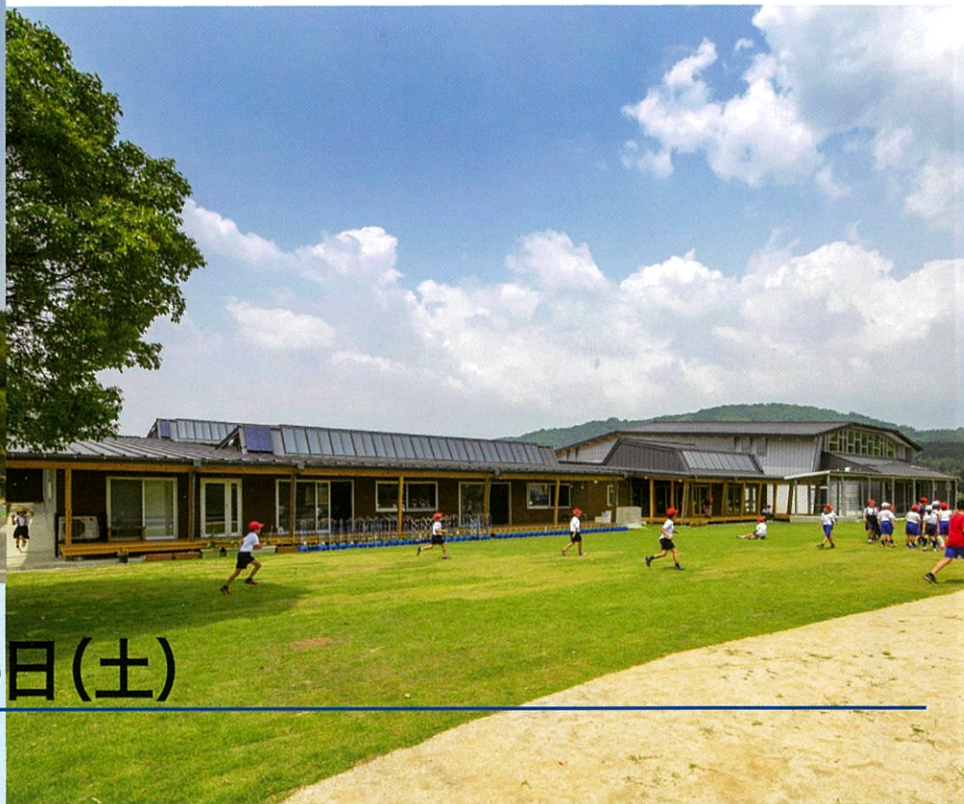
和水町立三加和小中学校