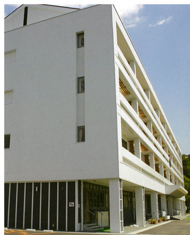
倉敷市立倉敷西小学校