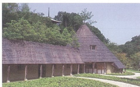
神勝寺 寺務所(松堂) 設計:藤森照信