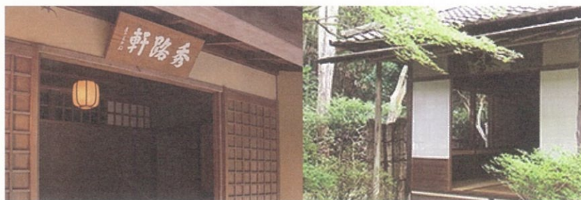
秀路軒及び一來亭 設計:中村昌生