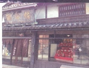
ポニョの町 鞆の浦 / 当日は街並み雑祭り