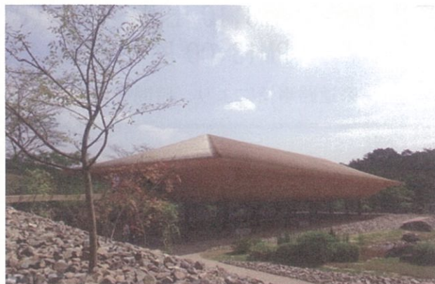
神勝寺 禅と庭のミュージアム 2016年9月開館 設計:名和晃平 / SANDWICH