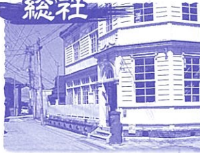
●NPO法人総社商店街筋の古民家を活用する会