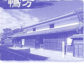
●かもがた町家管理組合