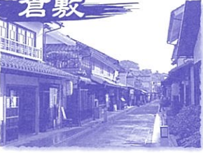
●倉敷伝建地区をまもり育てる会 ●NPO法人倉敷町家トラスト