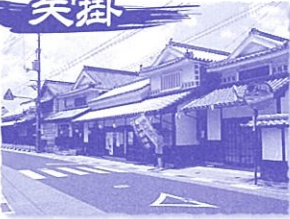
●備中矢掛宿の街並みをよくなる会