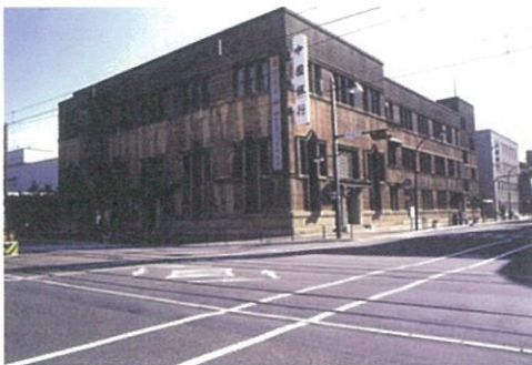
外観 独逸表現主義の様相