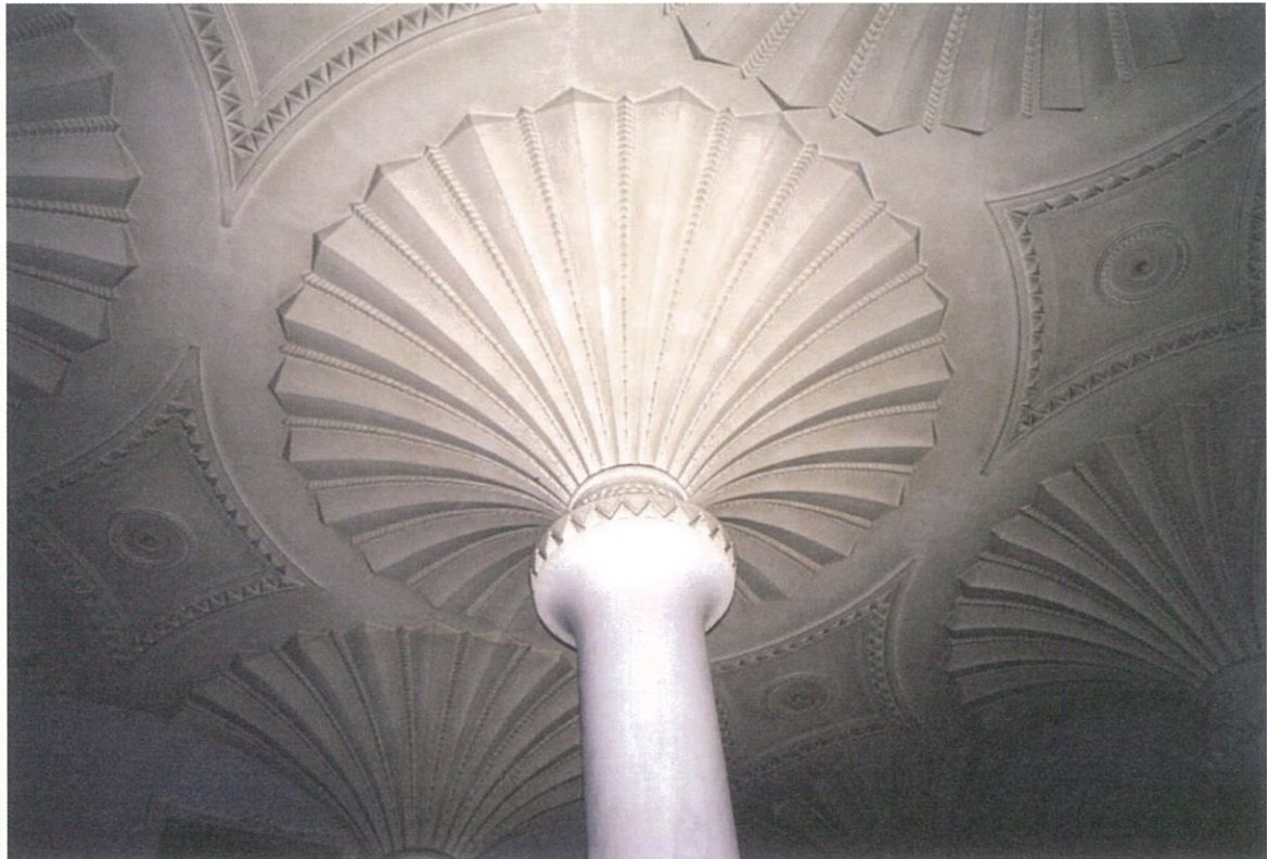
一階営業室 フェニックス（不死鳥）をテーマに表現

10:00～18:00（最終日 16:00） 入場無料 会場：さん太ギャラリー 山陽新聞社本社ビル2F （岡山市北区柳町2-1-1 / J R岡山駅南 市役所筋 徒歩15分）