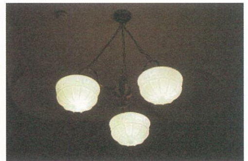
重役室の天井・照明器具

□展示説明会 10月1日（土） 13:30-14:00 / 15:00-15:30 10月2日（日） 11:00-11:30 / 13:00-13:30