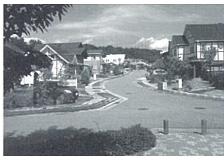
第11回 住まいのまちなみ賞 一般社団法人舞多間エコ倶楽部 (兵庫県神戸市垂水区)