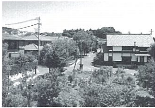
第11回 国土交通大臣賞 池田の森農園クラブ (静岡県静岡市駿河区)