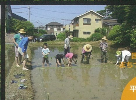
第11回 国土交通大臣賞 池田の森農園クラブ(静岡県静岡市駿河区)