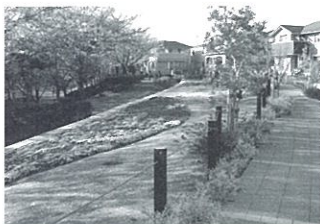
第11回 住まいのまちなみ賞 かずさの杜ちはら台管理組合 (千葉県市原市)