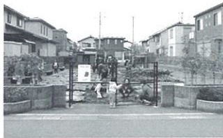
第11回 住まいのまちなみ賞 アップルタウン高田北街づくり組合 (福岡県糸島市)