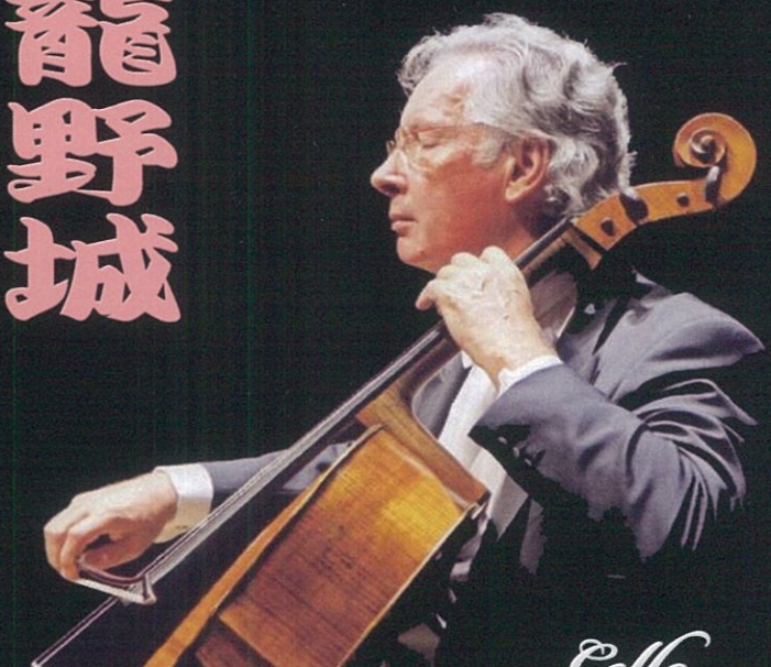
Cello アダルベルト・スコチッチ