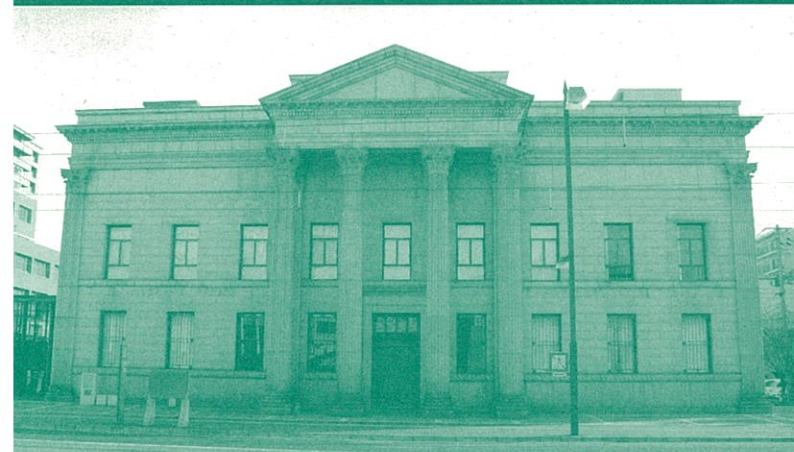
ルネスホール(旧日本銀行岡山支店)